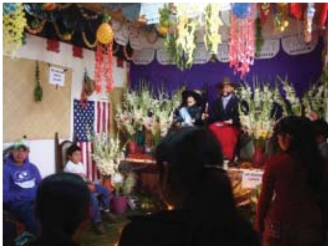
Foto 4. Cofradía de San Simón, aldea San Lorenzo, Tecpán. Fotografía: Marta Gutiérrez (2012).