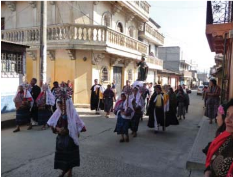
Foto 5. Texeles y cofrades en procesión de San Juan Evangelista hacia la casa del nuevo Cofrade Mayor. (27 de diciembre de 2012).