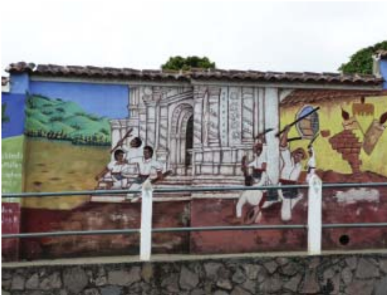
Foto 2. Representación de la confrontación entre cofrades y el nuevo liderazgo católico en 1967, en el Mural “Memoria histórica, cultura de paz y visión del futuro, en San Juan Comalapa”, elaborado en 2002. Fotografía: María Victoria García V. (mayo 2012)

perspectivas y estrategias distintas respecto a las formas de luchar y construir autodeterminación frente al Estado y las élites ladinas 8 . El momento evocado en las memorias comalapenses como decisivo en la confrontación entre cofrades y nuevos líderes católicos, es el enfrentamiento ocurrido el 28 de diciembre de 1967. Ese día, los dirigentes de las nuevas organizaciones, apoyados por el párroco, intentaron tomar el control del templo San Juan Bautista, cuando los cofrades participaban en festividades tradicionales. Ambos grupos se enfrentaron violentamente y el sacerdote huyó. Las nuevas organizaciones religiosas no regresaron más al templo de San Juan y un año después fundaron la iglesia Sagrado Corazón de Jesús (ver foto 2).