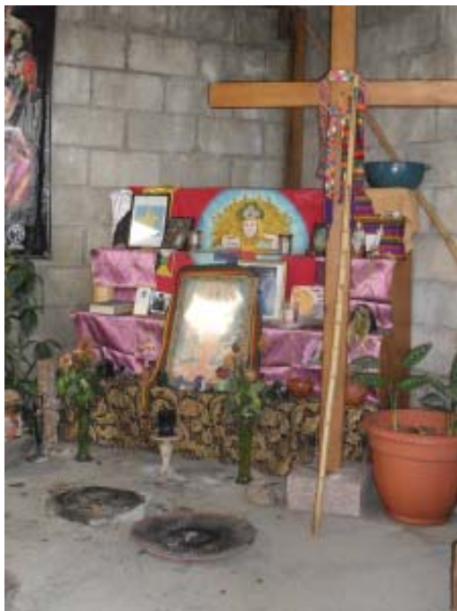
Foto 5. Altar en la casa de un guía espiritual indígena Barrio La Asunción, Tecpán.