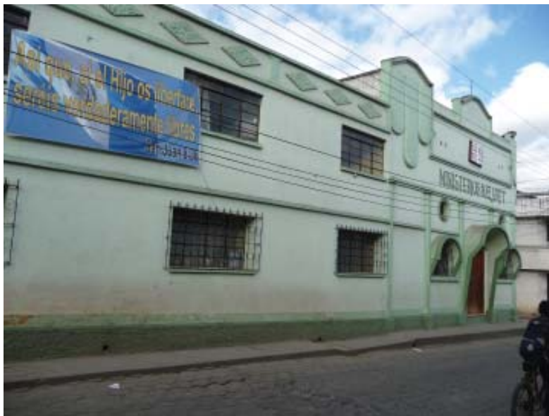
Foto 4. Iglesia Ministerios Nazareth (independiente). Fotografía: María Victoria García (noviembre 2012).