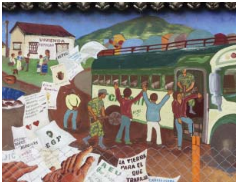
Foto 1. Representación del contexto político posterremoto de 1976, en el Mural “Nuestra Historia, Nuestra Memoria”, San Juan Comalapa, elaborado en 2006. Fotografía: María Victoria García V. (julio 2012).

Dos iniciativas mayores en torno a la memoria sobre la guerra se han desarrollado en la última década, una de ellas ha sido impulsada por CONAVIGUA 7 , organización que además de su lucha en contra del reclutamiento forzoso y del apoyo económico para las viudas del conflicto