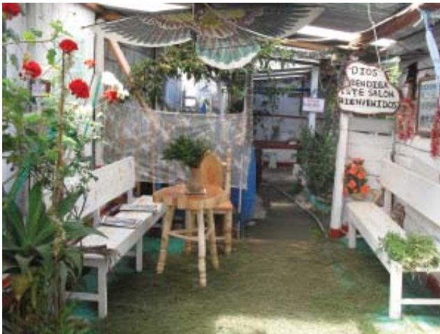
Fotos 2 y 3. Decoración de casa evangélica-pentecostal, Barrio San Antonio, Tecpán.