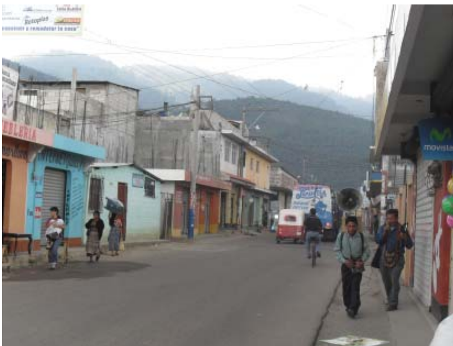
Foto 6. Predicadores en una de las principales calles de Tecpán.