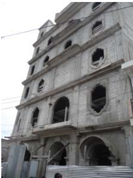
Foto 3. Iglesia Bethlehem (Centroamericana), San Juan Comalapa. (junio 2012).