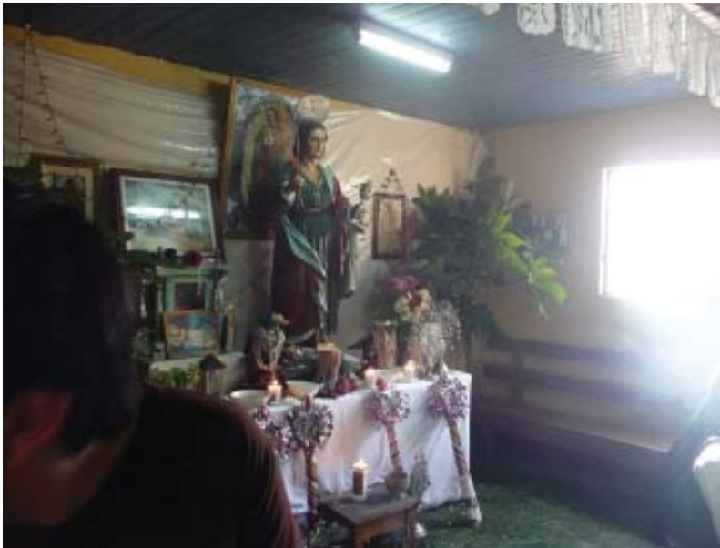
Foto 6. Imagen de San Juan Evangelista, águilas y símbolos de los cofrades y texeles.